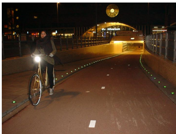
Tunel in pločnik - Amsterdam