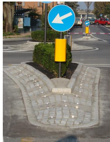
Prometni otok Italija