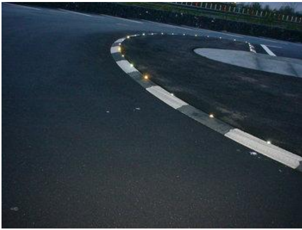
Krožišče na Nizozemskem