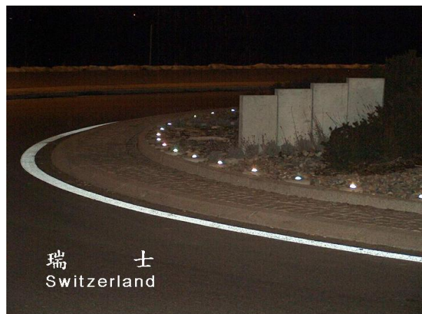
Krožišče podprto s Siglite SIG 25