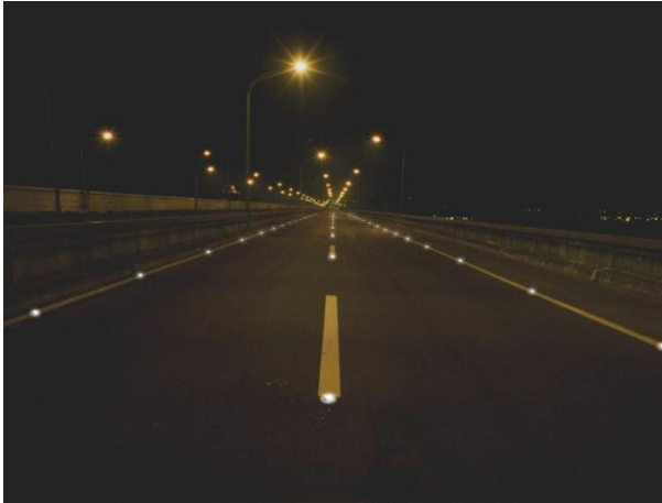
Avtocesta Siglite SIG 19