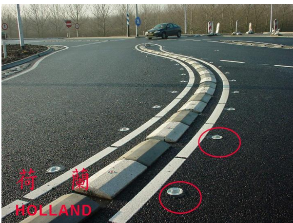
Razmejitev pasov s podporo Siglite az nočne razmere