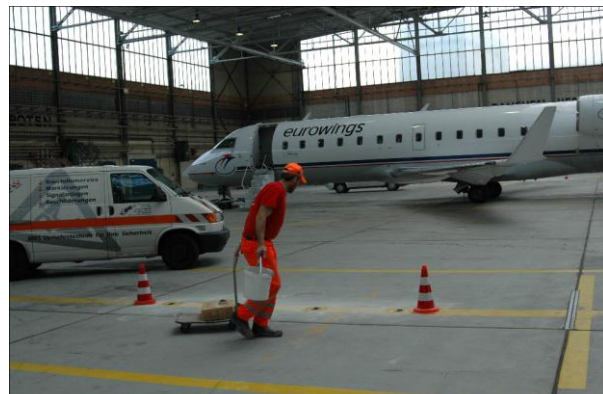
Siglite SIG 14mm jantarne barve v hangarju (Letališče Düsseldorf)