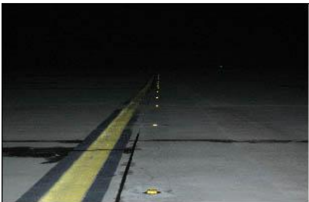
Letališče Frankfurt-Hahn. Siglite SIG 14 jantarne barve. Nočna podpora usmerjevalne črte. Barvna oznaka v nočeh in dežju praktično ni vidna.